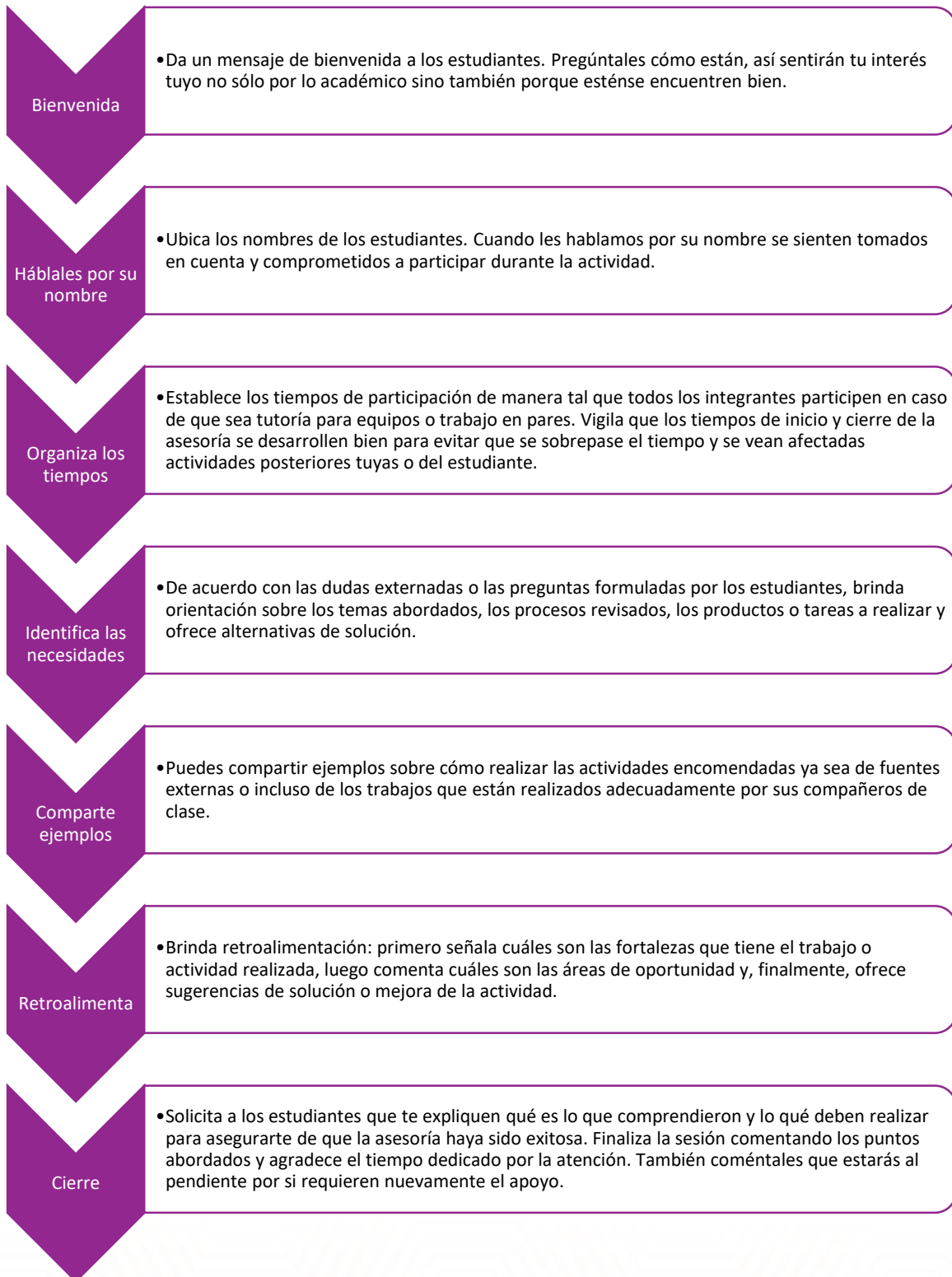
Figura 2. La realización de la asesoría.